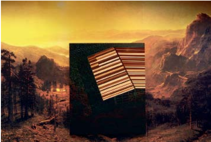
Here and Now, 2008. Her og nu

Et panorama over det vilde vesten badet i gyldent lys er blokeret af et kæmpemæssigt sort kvadrat. Det geometriske fremmedlegeme spærrer udsigten til det mytologiske amerikanske landskab. Den sorte firkant brydes af en brunstribet v-form. Konstruktionen er et tag set fra oven. Fine røde og blågrønne linjer danner et mønster i kvadratets sorte bund. Mønsteret samler sig til menneskekroppe.