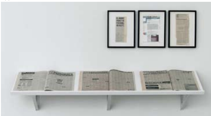
SEXY SEMITE, 2000-02 SEXY SEMIT

SEXY SEMIT har været bragt i newyorker-avisen The Village Voice i 2000, 2001, 2002. Da annoncerne blev trykt i 2002, udløste de bl.a. mistanken om et forestående terrorangreb. I Jacirs værker er grænsen mellem kunst, virkelighed og politisk aktivisme flydende. Ved at vælge kontaktannoncen som udtryksform er hun i stand til at infiltrere medierne på overraskende vis og lade andre stemmer komme til orde end politikernes.