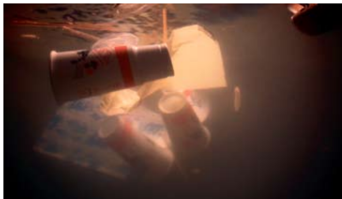
Flooded McDonald's, 2008 (stills) Oversvømmet McDonald's