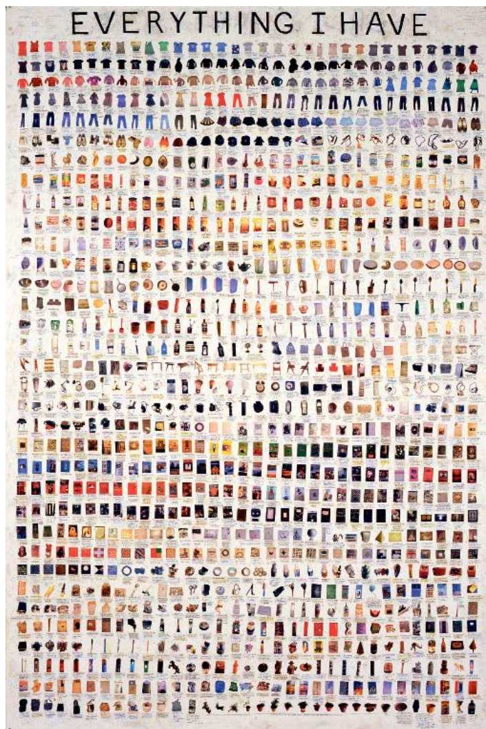
Everything I Have , 2008