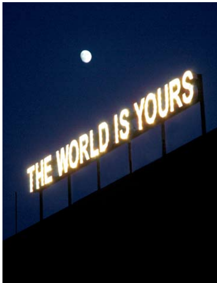
The World Is Yours, 2005 Verden er din

Foto: Paulo Seabra. Ellipse Foundation - Contemporary Art Collection, Portugal