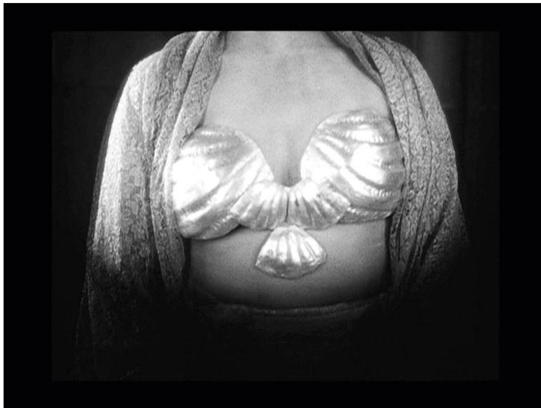
Germaine Dulac, Præsten og Konkylien , 1927