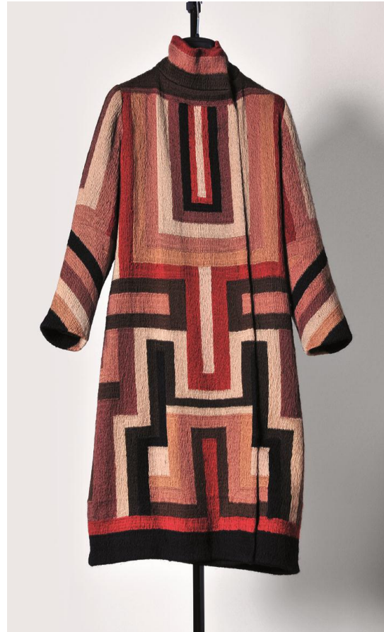
Sonia Delaunay, Frakke til Gloria Swanson , 1923/23