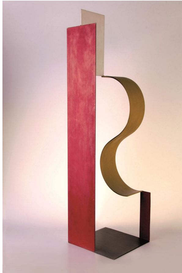
Katarzyna Kobro, Rum-komposition , 1928