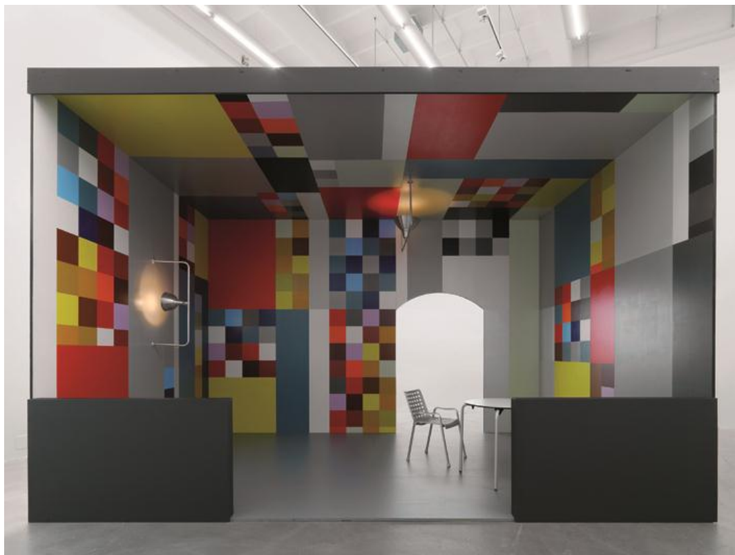
Sophie Taeuber-Arp, Bar Aubette , 1926-28