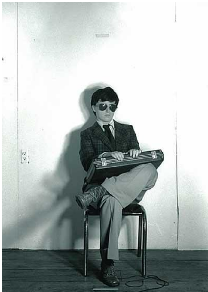
Cindy Sherman, Bus Riders , 1976