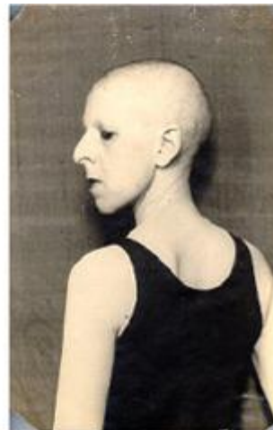
Claude Cahun, Selvportræt, Claude Cahun som ung pige , 1915 Claude Cahun, Selvportræt (kronraget) , 1929