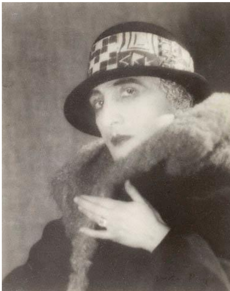
Man Ray, Rose Sélavy , 1921