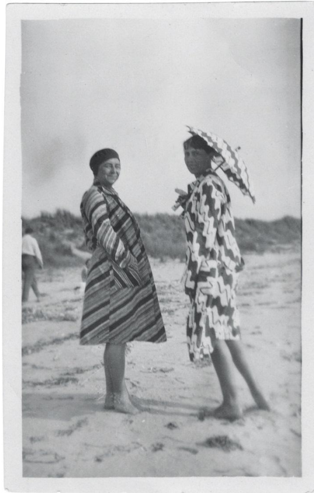
Sonia Delaunay og Sophie Taeuber-Arp på stranden ved Carnac, august 1929, iført strandmode, designet af Sonia Delaunay