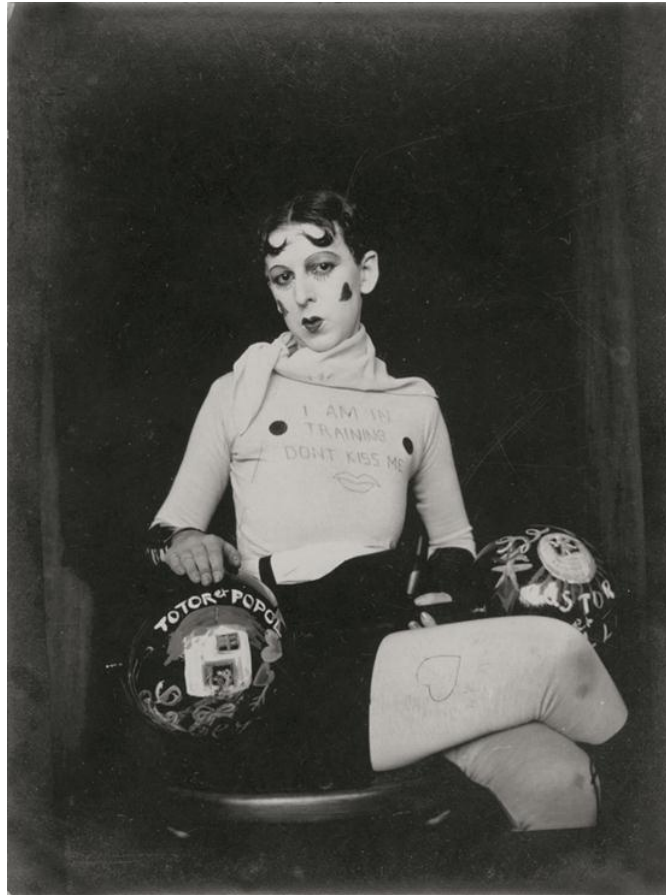
Claude Cahun, Selvportræt (som vægtløfter) , 1927