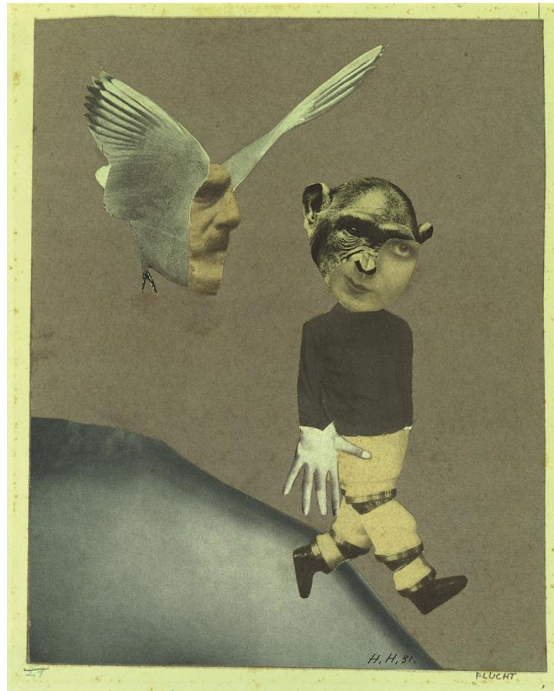
Hannah Höch, Flucht , 1931