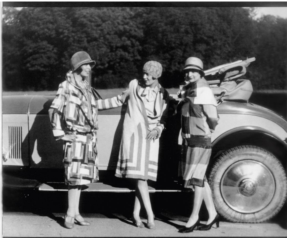
Sonia Delaunay og Sophie Taeuber-Arp, Bretagne, 1929