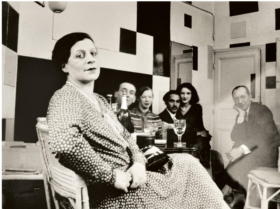
Florence Henri med venner på besøg hos Piet Mondrian (til højre), Paris, 1930