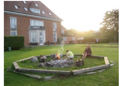
Bålaften på vandrehjemmet i Helsingør