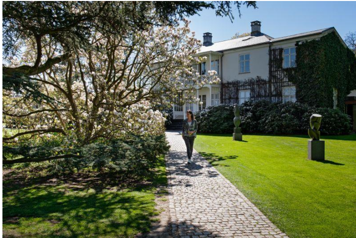
Louisiana. Den gamle villa set fra parken.

til Helsingør, hvor kunstnerne Elmgreen & Dragsets nyfortolkning af den lille havfrue: HAN kan ses. Derudover kan I opleve Kulturværftet, der er blevet et samlingspunkt for Helsingør by eller M/S Museet for Søfart, der med den nye bygning af tegnestuen BIG bidrager til udviklingen af Helsingørs byrum på havnen.