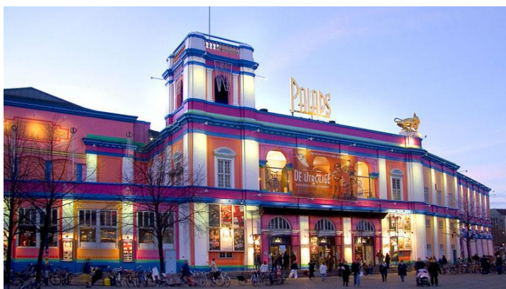
Poul Gernes: Palads biografen i København.

Efter morgenmad på vandrehjemmet, mødes vi på Louisiana 11.15 til en 2-timers workshop med øvelser, der tager afsæt i arkitekturen omkring os. Her lærer vi grundprincipper for at tale og se på bygninger og rum ved at kigge nærmere på Louisianas arkitektur. Frokosten spiser vi på Louisiana. Eftermiddagen kan stå på en bustur til Fredensborg, hvor I finder klyngehuse af den verdensberømte danske arkitekt, Jørn Utzon og Fredensborg slot. Eller I kan tage en tur til København med en byvandring, hvor I bl.a. ser Paladsbygningen, udsmykket af Poul Gernes, som optakt til sidste dag på Louisiana med Gernes på programmet. Om aftenen er der aftensmad og hygge på vandrehjemmet i Helsingør.