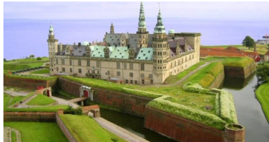
Kronborg Slot, Helsingør

Ankomst om eftermiddagen til vandrehjemmet i Helsingør, hvor I tjekker ind og ser lidt på de lokale omgivelser. Kl 18 spiser I aftensmad og har en hyggelig bålaften i vandrehjemmets have ud til Øresund. Medbring kameraer.