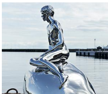
HAN af Elmgreen & Dragset. Kulturhavn Kronborg.

Efter morgenmad på vandrehjemmet, mødes vi på Louisiana kl 10.30. Velkomst i parken og introduktion til en uge med kunst på skemaet. Om formiddagen er temaet "krop og kunst" i en 2-timers workshop med 1 time i udstillingerne og 1 time i værkstedet. Vi spiser frokost i cafeen, og bagefter står den på kropslige tegneøvelser i skulpturparken, hvor vi ser, hvor forskelligt vi tegner og fortolker kroppen. Om eftermiddagen går turen tilbage til Helsingør, og her kan I bl.a. besøge Kronborg Slot. Aftensmad og hygge på vandrehjemmet.