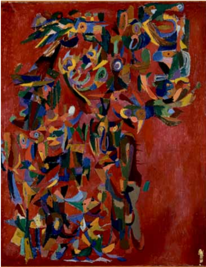
Uden titel, 1943-44, 125 x 99,7 cm, olie på lærred Donation: Ny Carlsbergfonden Louisiana Museum of Modern Art