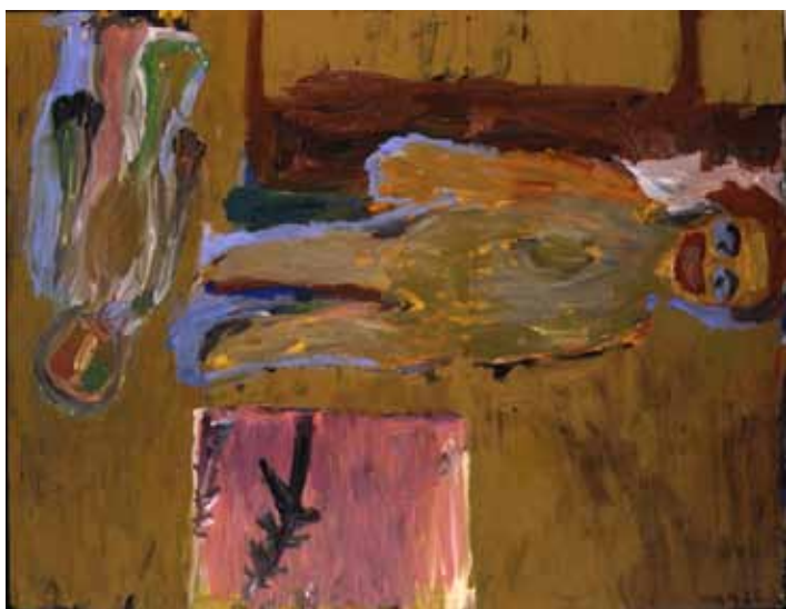
Georg Baselitz Das Liebespaar, (Kæresteparret,) 1984 Olie på lærred, 250,5 x 330 cm Louisiana Museum of Modern Art

Jorn ændrer og overmaler gerne sine billeder. En serie billeder kalder han modifikationer. Det er billeder af skovsøer og brølende kronhjorte, han finder på loppemarkeder. Ved at overmale dem giver han det eksisterende billede nyt liv. Foranderligheden optager Jorn frem for klassisk skønhed og harmoni.