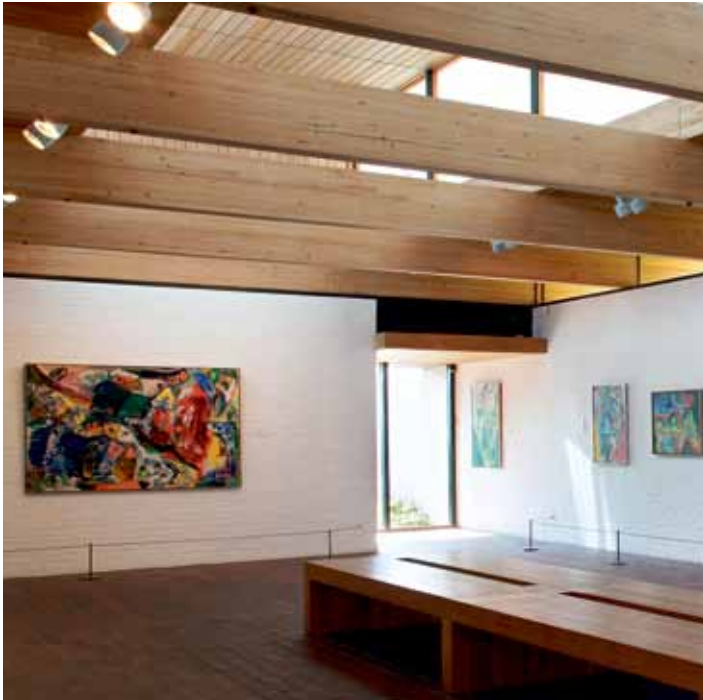
Jorn rummet Louisiana

Kunstens inderste væsen er at gribe mennesket. Er kunst ikke gribende er den simpelthen mislykket.