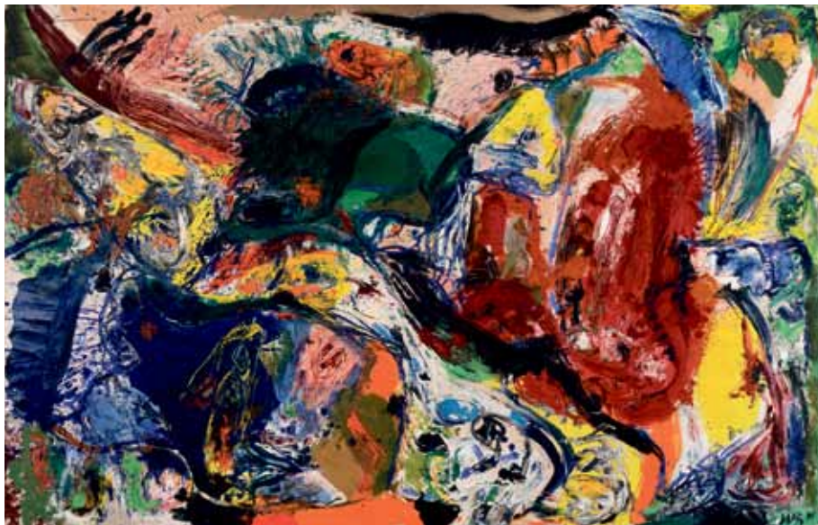
Dead Drunk Danes (Døddrukne danskere) 1960, Olie på lærred 130 x 200,5 cm, Donation: Louisiana - Fonden Louisiana Museum of Modern Art

Figurerne er på det nærmeste opløst i maleriet. Malingen sjasker, strinter, sprøjter, skraber og ridser hen over lærredet alt afhængig af Jorns bevægelser. Billedet er dog holdt sammen af en diagonal linie og større plamager af rød, grøn og blå. Efter et stykke tid foran maleriet vrirler det frem med figurer, dyr og mennesker. Intet maleri bør være helt abstrakt, mener Jorn.