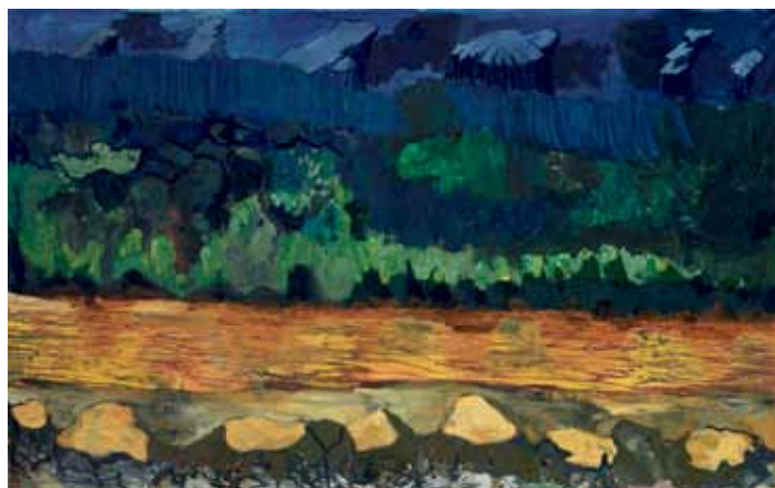
Per Kirkeby Weltuntergang, (Verdens Undergang,) 2001 Olie på lærred, 300 x 500,5 x 3,5cm, Erhvervet med midler fra Ny Carlsbergfonden Louisiana Museum of Modern Art

I biblen starter alting med Guds ord, "I begyndelse var ordet". Men Jorn og Kirkeby er enige i det omvendte - at billederne kommer før ordene. Vores tidligste kunst fx hulemalerierne for ca. 20-40.000 år siden går meget længere tilbage end det skrevne sprog. Både Jorn og Kirkeby mener, at billederne ikke bare skal være illustrationer af fortællingerne, men at de selv danner fortællingerne. Det er når vi ser på billederne, at fortællingerne opstår.