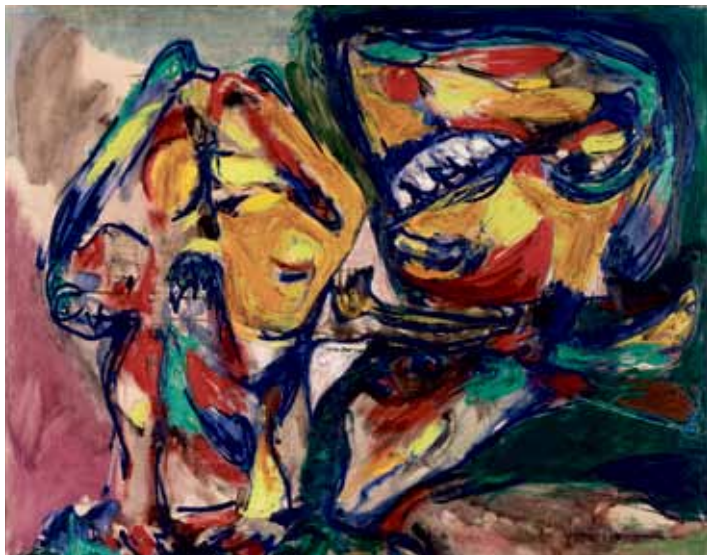
L'Adieu des amants, (De elskendes farvel,) 1955 Olie på lærred, 78,5 x 99 cm, Donation: The Merila Art Foundation, ved Dennis og Jytte Dresing Louisiana Museum of Modern Art

Kort før dette billede blev til, har Jorn forladt Danmark. I billedet er det de elskende, der tager afsked. Manden er malet og ridset som en energisk, vibrerende, svævende figur. Kvinden til venstre står som en solid klump på fødder. Der er intet svævende over hende, som hun står der med tunge øjne.