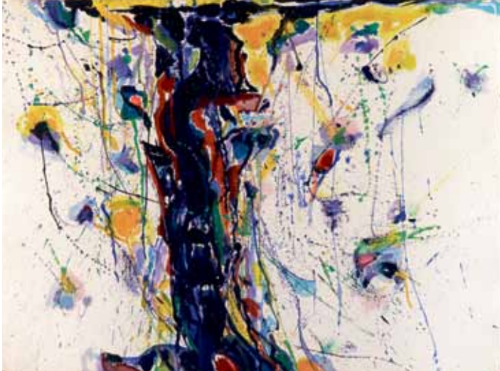
Sam Francis Uden titel, 1957 Gouache på papir, 57 x 77 cm Donation: Sam Francis Louisiana Museum of Modern Art