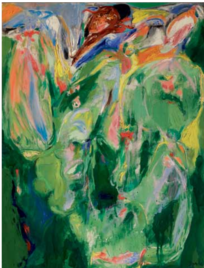
Øjets blikstille, 1971 Olie på lærred, 116 x 89 cm, Donation: The Merla Art Foundation, ved Dennis og Jytte Dresing Louisiana Museum of Modern Art

Per Kirkeby i Interview, "Alt kommer af intet", 2001