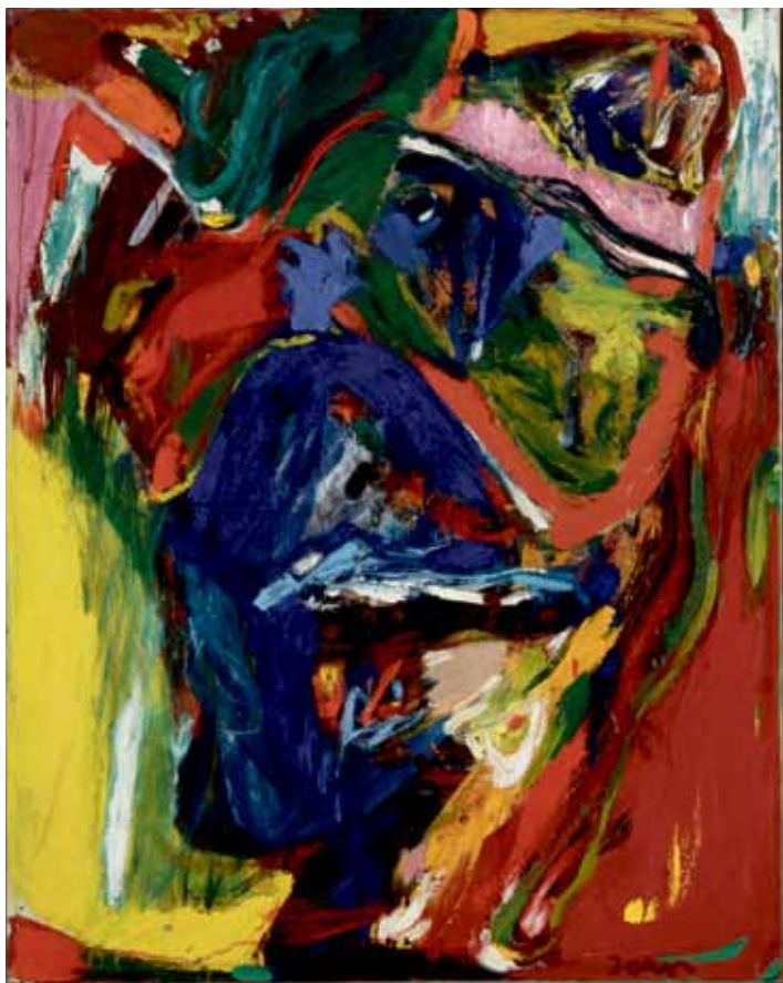
A Travers les Nuages, (Gennem skyerne,) 1967 Olie på lærred, 92 x 73 cm Donation: The Merla Art Foundation, ved Dennis og Jytte Dresing Louisiana Museum of Modern Art

Al fornyelse består i at kaste sig ud i det ukendte og dermed i den næsten sikre tilintetgørelse