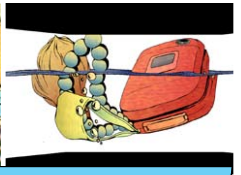
Tabaimo: Public ConVENience, 2006. Videoinstallation. Foto: Jason Mandella. Installationsfoto fra James Cohan Gallery, New York. © Tabaimo / Courtesy of Gallery Koyanagi and James Cohan Gallery