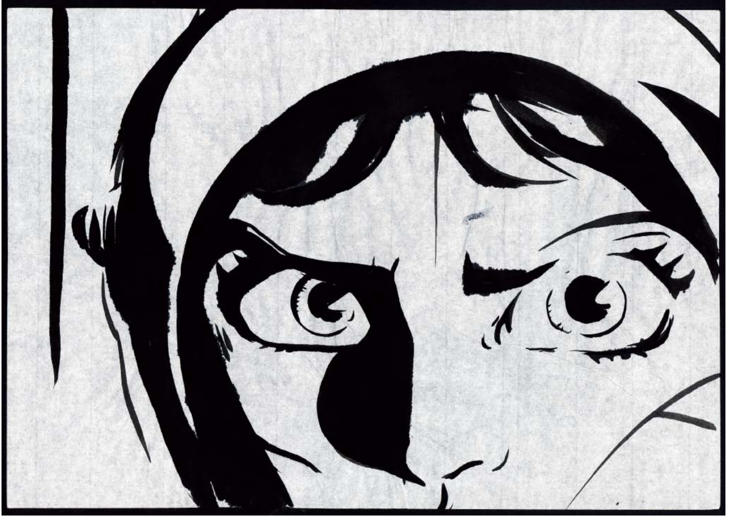
Yoshitaka Amano: Uden titel, ca. 2002.

Øjnene er vigtige i Yoshitaka Amanos billeder. Der er ikke meget andet at se. Figuren har noget på hovedet – måske en flyverhjelme?