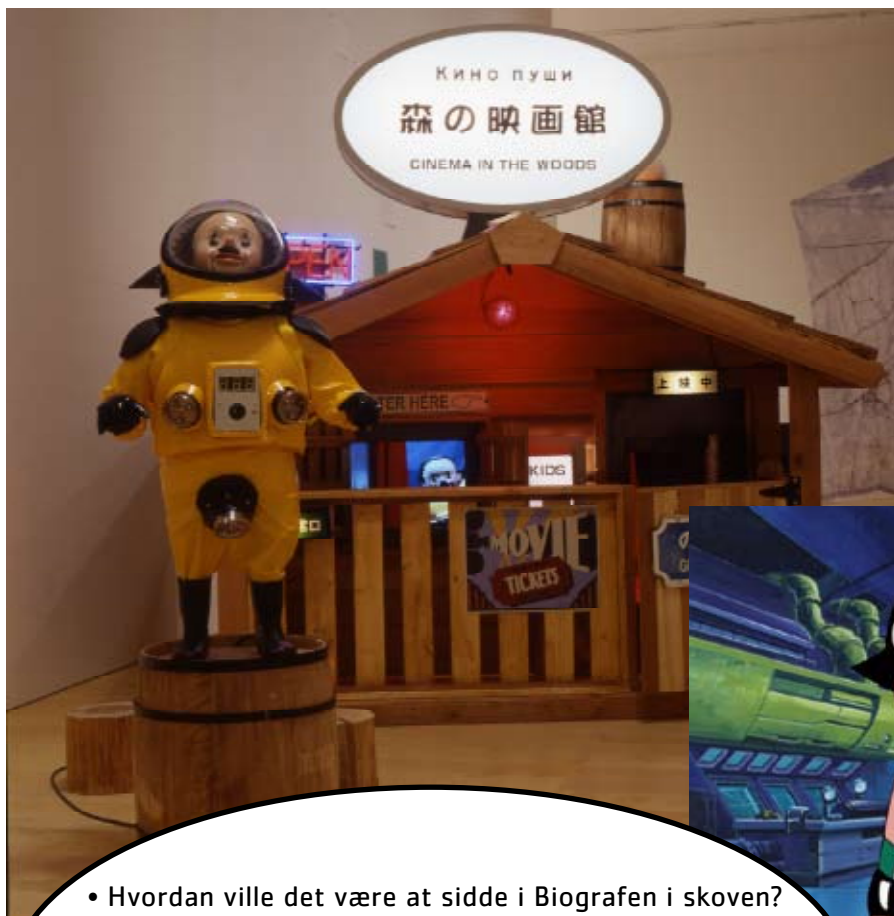
Kenji Yanobe, Biografen i skoven, 2004. Blandteknik.

Manga og anime kan også handle om atomkraft. Astro Boy er en atombrevet robot, som er skabt af en videnskabsmand, der vil genskabe sin døde søn. Men selv om robotten får menneskelige egenskaber, vil den altid være en maskine. Manden smider Astro Boy ud, fordi han alligevel ikke ligner hans søn nok. I stedet for kommer Astro Boy til at bo hos en mand, som prøver at lære ham at være som en almindelig dreng, selv om han har superkræfter. Astro Boy er en mellemtung mellem menneske og maskine.