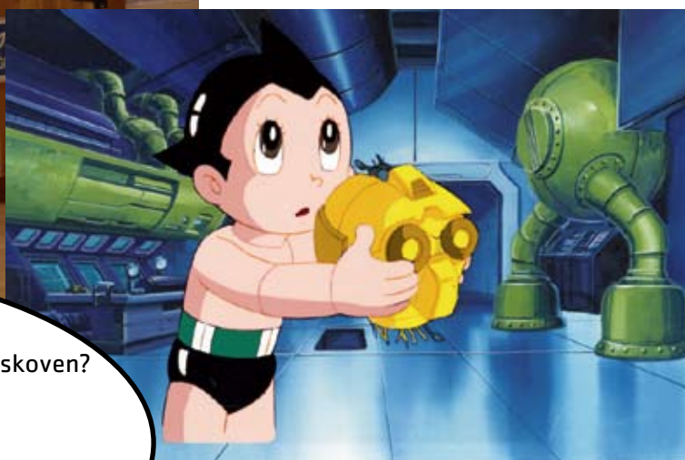
Astro Boy, billede fra anime-serie instrueret af Hiroshi Sasagawa, produceret af Mushi Production Co. Lt., siden 1963.