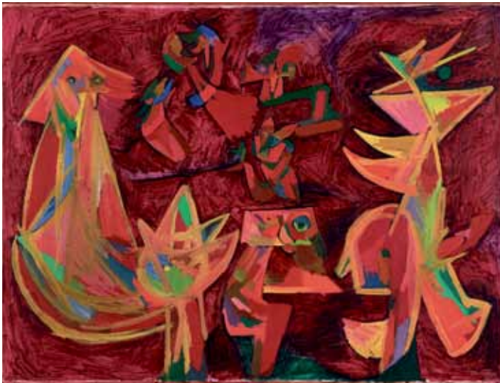
Both worlds, (Begge verdener,) 1944 Olie på lærred, 74 x 99 cm Donation: The Merla Art Foundation, ved Dennis og Jytte Dresing Louisiana Museum of Modern Art

Hvor figurerne i Titania II var viklet ind i hinanden, griber figurerne i Begge Verdener snarere ind i hinanden som et puslespil. Nogle af figurerne er takkede og aggressive, andre bløde og runde. I midten af billedet sidder et lille væsen ved en skrivepult og kigger ud på os med sit ene blå - grønne øje. Det andet falder i ét med ansigtet, som om det kigger ind i sig selv. Figuren er omkranset af to større figurer og henover danser fire små væsener med runde øjne. Figurerne i forgrunden er gule og lysende, i baggrunden glider de ind hinanden.