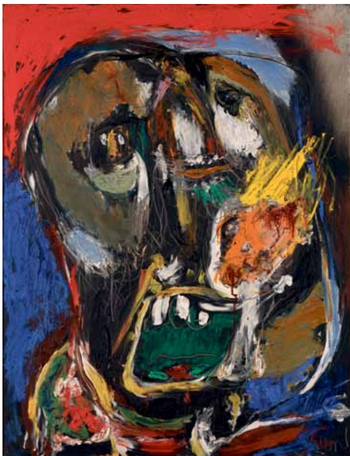
La Double face, (Dobbeltansigtet,) 1960 Olie på lærred, 116,5 x 89,8 cm Louisiana Museum of Modern Art

Gå på opdagelse i Louisianas samling og find andre skildringer af forholdet mellem manden og kvinden.