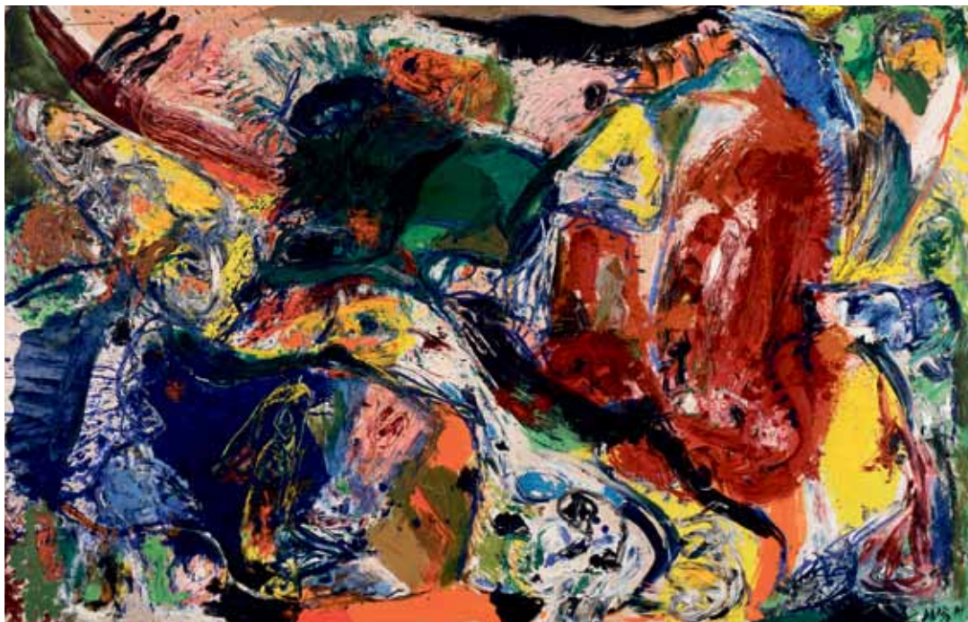
Dead Drunk Danes (Døddrukne danskere) 1960, Olie på lærred 130 x 200,5 cm, Donation: Louisiana - Fonden Louisiana Museum of Modern Art

Figurerne er næsten væk i maleriet her. Jorn har forladt automattegningen. Farven eksploderer på lærredet. Malingen sjasker, strinter, sprøjter, skraber og ridser hen over lærredet. Efter et stykke tid foran maleriet vrimler det dog frem med figurer, dyr og mennesker. Intet maleri bør være helt abstrakt, mener Jorn.