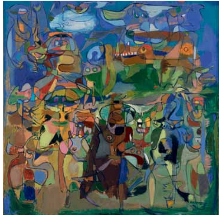
Titania II, 1940-41 Olie på lærred, 120,5 x 115,5 cm Louisiana Museum of Modern Art

På Louisiana findes der et rum med malerier af Jorn. Det skifter hvilke billeder der er fremme. Jorns malerier kan tale sammen med andre af museets kunstværker af både ældre og nyere kunstnere. Nogle af dem vil du møde her.