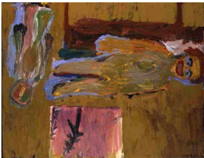
Georg Baselitz Das Liebespaar, (Kæresteparret,) 1984 Olie på lærred, 250,5 x 330 cm Louisiana Museum of Modern Art

Maleriet ser helt anderledes ud end første gang det bliver udstillet i Paris. Her viser det en stor figur. Den store figur våger over tre mindre masker. Men Jorn er ikke tilfreds. Han tager billedet tilbage, vender det på hovedet og overmaler de gule og grønne farver med rød.