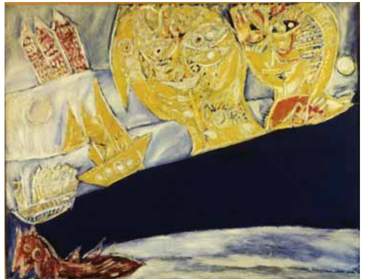
Carl-Henning Pedersen Mennesker og havet I, 1949 Olie på lærred, 162 x 208,5 cm Louisiana Museum of Modern Art

Cobra-kunstnerne vil have en verden, hvor der er plads til frihed og fantasi. De vil lave billeder, som alle mennesker kan forstå. Cobra-kunstnerne lader sig inspirere af børnetegninger og primitiv kunst, som fx afrikanske masker og skulpturer. De mener, at disse udtryk er mere ægte, fordi de er skabt af mennesker, der ikke har gået i skole for at lære at lave kunst.